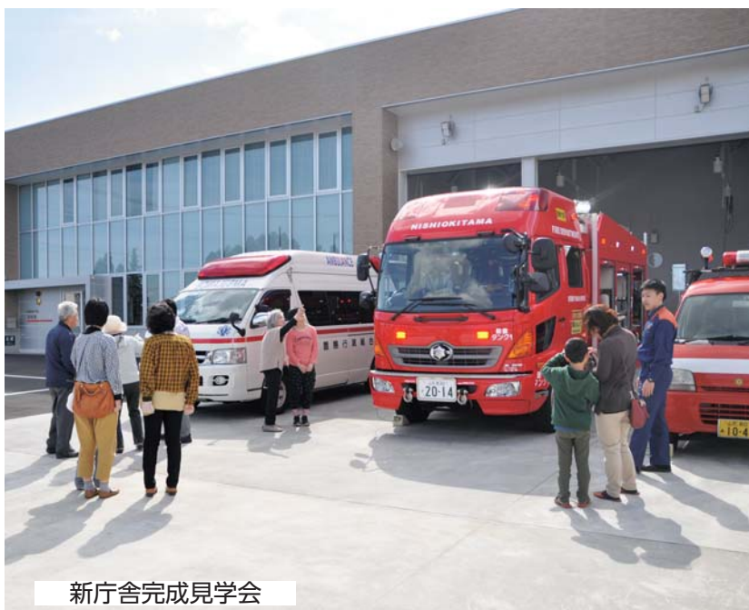
新庁舎完成見学会