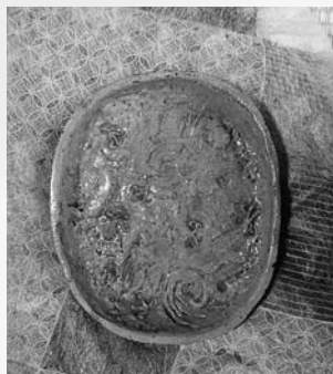
長寺様寺宝の龍文皿

前回は江戸時代の早い時期に操業した樁焼裏山窯のお話しをしました。裏山窯は17世紀の終わり頃には操業をやめてしまうのですが、その後、樁には新たな窯が興ります。18世紀末から19世紀の初め頃のことです。これは米沢藩に上杉鷹山が登場し、傾いた藩の財政を立て直すべく奮闘している時期で、この際に、鷹山の改革の一環として藩内で多くの産業が興ります。窯業もその一つでした。当時、飯豊町の小白川や樁に、越後から多くの人が移住していました。この中に焼物の技術者がいたので、市内という名前