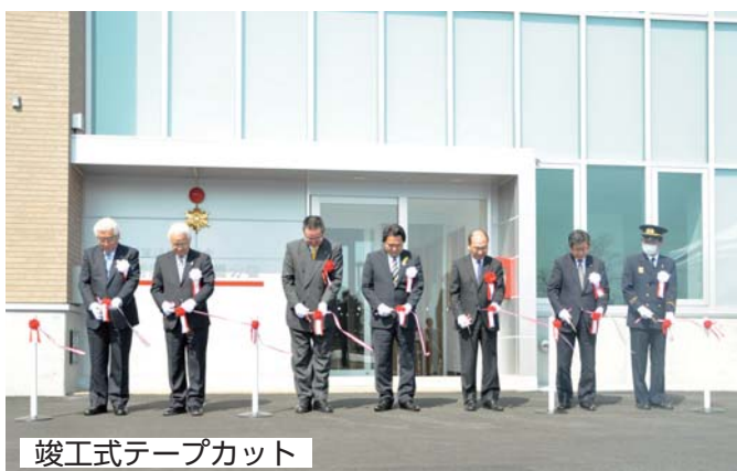
竣工式テープカット

この度完成を迎えた飯豊分署は、町内中津川地区や隣接する小国町にも出動しやすい椿地区に建設され、西置賜地域約6万人の防災拠点の1つとして建設されました。