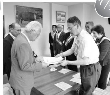
町保護司による「社会を明るくする運動」への協力依頼（役場）