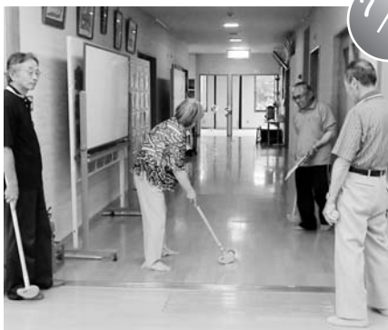
ふるさと学園・食生活改善推進員合同研修（西部地区公民館）

8月3日、中津川地区公民館で、中津川チャレンジクラブによる郷土料理の笹巻づくりが行われ、地区内の1年生から5年生までの7名が参加しました。笹は近くのを自分たちで摘み取り、餅米とスゲも中津川産です。笹を三角に折り、丁寧に餅米を入れ、スゲを使って結ぶ作業を行い、「結び方が難しい」「餅米がこぼれてしまう」などと苦戦。その分、出来上がった笹巻をおいしそうに頬張っていました。