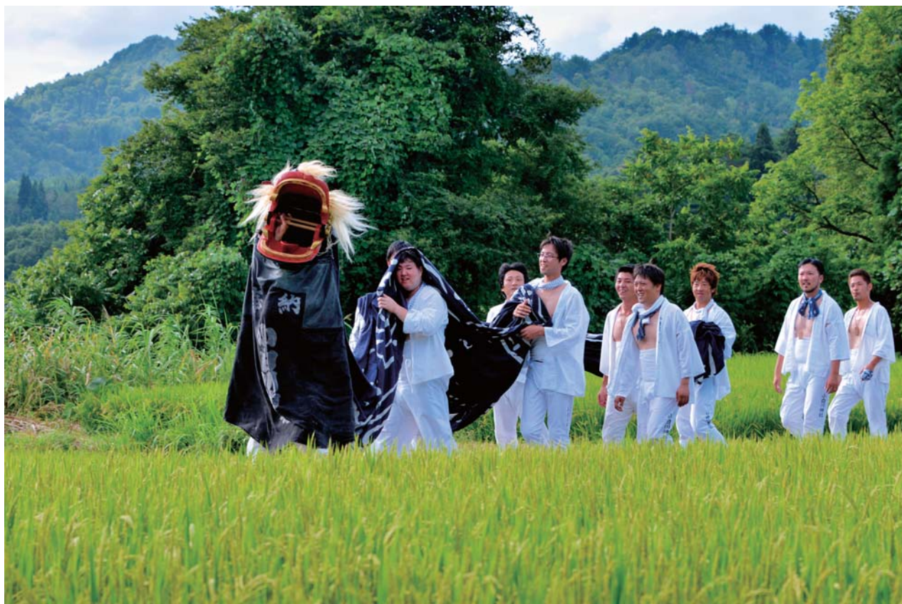
ISO320 1/320秒 F8