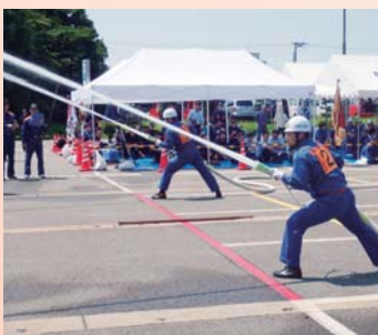
2線共に的確な放水技術