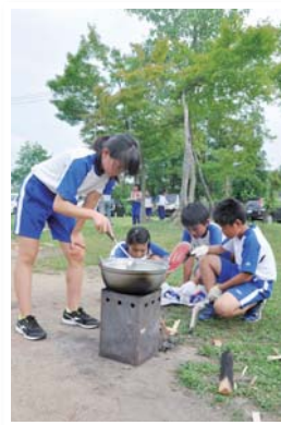
調理をする児童と火加減の調整をする児童が協力してのカレーづくり

7月22日～23日、飯豊少年自然の家で東部少年キャンプが行われ、添川小の4～6年生の23人がフィールドアスレチックや野外炊飯、ナイトハイキングやキャンプファイヤーを体験しました。初日にはカレー作りに挑戦。まきをくべながらの火おこしでは、汗だくになりながら奮闘。火加減の調整がうまくいくと、切り分けた材料を入れて調理を始め、協力しながら作業を進めました。