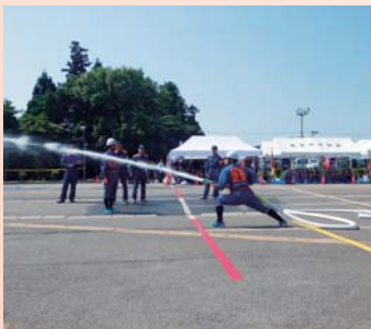
抜群の速さで的を射抜く