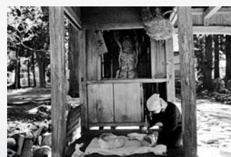
仁王像の解体作業