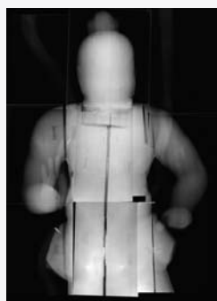
仁王像のレントゲン写真

負担するのは大変なことです。そんな中、運よく朝日新聞文化財団より206万円の助成を頂戴できることになり、残りを地元の方々が負担することで修復に着手することができました。修復は現在実施中で来年には完了します。その際は是非、足が丈夫になるようにお参りにおいでください。お賽銭を忘れずに。