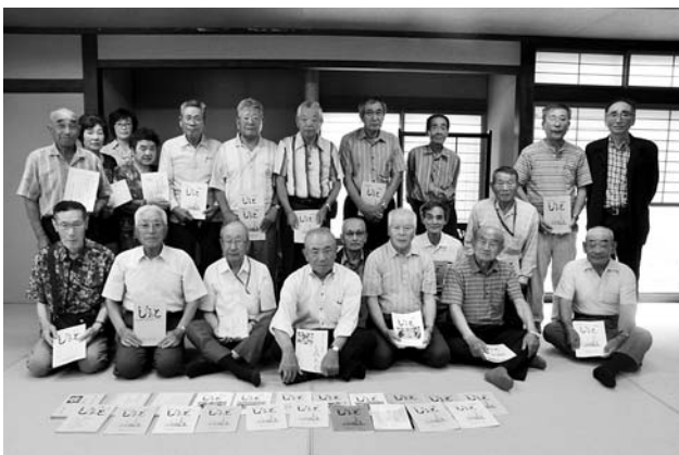
平成29年度開級式と、これまで発刊された文集

昭和47年に萩生長生会事業の1つとして「長生教室」が開設され、翌48年に公民館事業と合わせて「高齢者教室」に名称を変更。平成3年から、現在の「しろあと教室」として活動を続けてきました。 教室の活動内容や会員が得意とする短歌、俳句、随筆などを寄せた文集「しろあと」は、昭和51年に創刊号が発刊され、平成28年度の発刊をもって創刊から40周年を迎えました。全40冊にもおよぶ文集は、今でも大切に公民館で保管され、これまで歩んできた会の道のりを後世に受け継いでいきます。