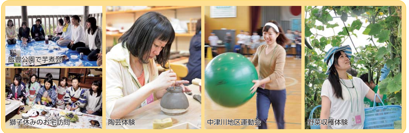
飯豊公園で芋煮会

9月16日から18日、田舎に興味があり帰郷や田舎暮らしを考えている女性の方を対象に「飯豊町帰郷希望女子応援プロジェクト」が実施されました。そのツアーの名は「飯豊とふれあい、つながる旅」。 主に首都圏から参加した9名の女性は、普段の生活では体験できない、野菜の収穫や地域の方々とのふれあいを通じて、飯豊暮らしのイメージを膨らませました。参加の動機はそれぞれで、友人に飯豊を勧められて、以前飯豊に来たことがあってもう一度来たかった、田舎暮らしを体験してみたい。それぞれの「くしたい」という思いを満たしてくれる素材が、町にはたくさんあります。そういった自然が残る田舎の魅力や体験したことのない文化を存分に味わえるツアーを満喫されました。 東京都から親子で参加された方は「子どもが以前から田舎に行きたいと言っていました。自然の中での暮らしを体験してみたいと。今回参加してみて、野菜の収穫のしかたを教えてくださいたい、気さくに話しかけてくれたり、何より地元の方の温かさに触れることができました。人と人とのつながりが、田舎暮らしの良さなんだと実感しました。」と感想を語っていました。 参加者は、それぞれのSNSから、体験で感じたことや町の魅力をPR。飯豊を知らない方々に、彼女たちの生の声で、町の魅力が発信されています。これからの、つながりの拡大が期待されます。