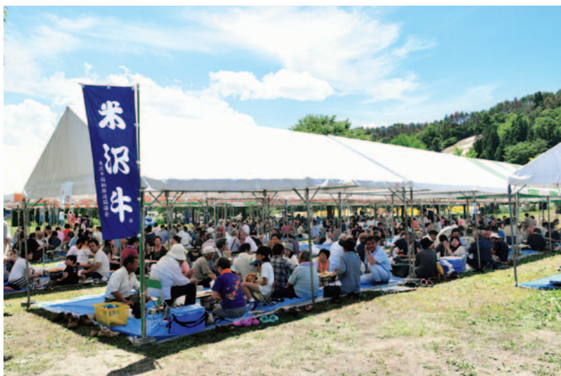
晴れ上がった空の下、30度を超える気温と炭火の熱で、汗だくになりながら 牛肉を楽しんだ参加者