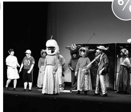
芸術鑑賞教室 (あ～す)