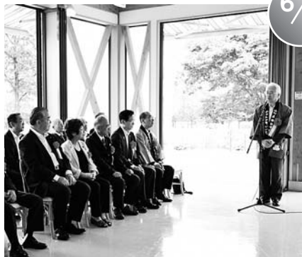
どんでん平ゆり園開園式 (どんでん平ゆり園)