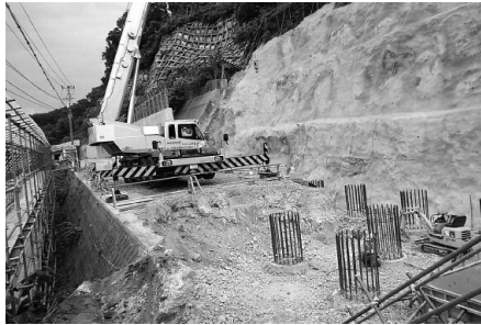
基礎杭と土台を連結する作業

また、白川ダム管理支所駐車場の県道西側斜面に雪崩対策として、高さ7mの鋼製柵を延長59mにわたり設置します。この工事は11月の完成を予定しています。皆様にはご不便とご迷惑をお掛けしますが、ご協力をお願いします。