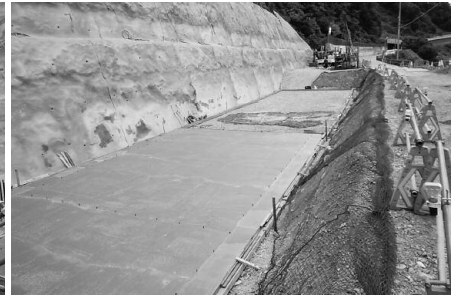
山側の擁壁の土台工事に着手