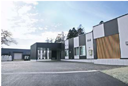
飯豊町起業支援施設