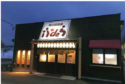
屋台村「i i d e ら」