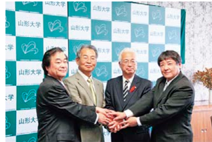
産学官金連携会見