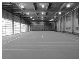
屋内グラウンド整備

スポーツ施設の適切な維持管理の他、本年度は町民スポーツセンター屋内グラウンドの人工芝化と柔剣道場の柔道畳の更新を行うなど、既存施設の利用増加と施設機能の発揮に向けた取り組みを進めていきます。