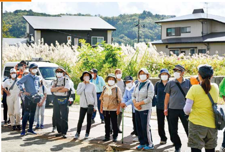
旧手ノ子小学校跡地で幸せになるという「かしばみの木」の説明に聞き入る参加者

近くにいなながら知らなかった地区の歴史 10月3日、手ノ子地区で西部ウオーキングが行われました。小学生から70代までの31名が、秋の爽やかな風を感じながら往復3.2キロメートルのウオーキングを楽しみました。コースには手ノ子地区の名所や歴史が詰まった場所が多数存在し、西部地区公民館職員が分かりやすく説明しました。参加者は「近くにいる知らないことがたくさんあったし、昔のことを思い出して懐かしくなった。皆に会って楽しい時間を過ごすことができた」と目を細めました。