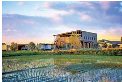
ホテルスロービレッジ