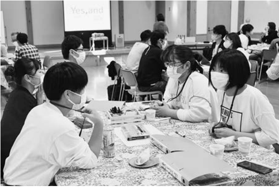
グループに分かれて話をする参加者

飯豊町在住者や通勤者など高校生から40代までの26名が参加しました。この企画は、第5次飯豊町総合計画の基本計画である「人をはぐくむまち」の取り組みの一環です。自分達がやりたいことや興味がある