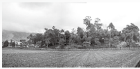
奈良県葛城市飯豊天皇陵 (北花内大塚古墳)