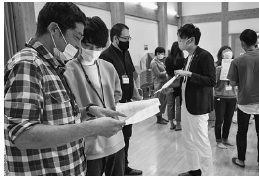
メンバーを知るための自己紹介タイム