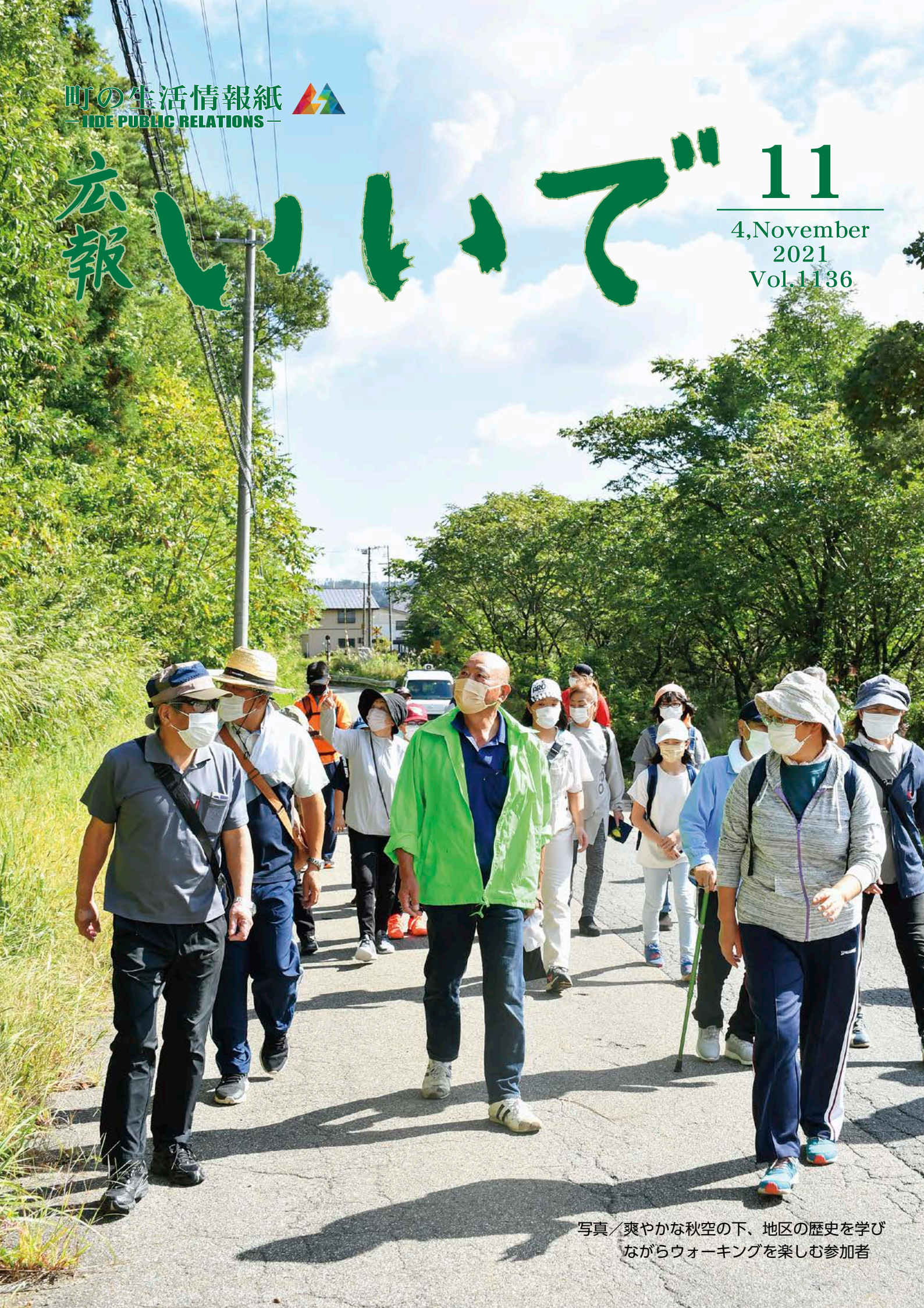
写真/爽やかな秋空の下、地区の歴史を学びながらウォーキングを楽しむ参加者