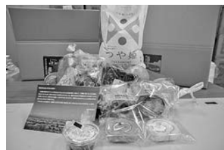
※写真は昨年実施のものです