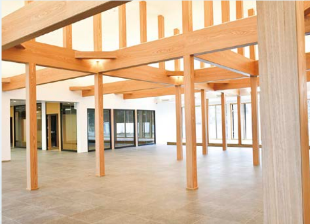
水没林をイメージした専門職大学の内部

飯豊町起業支援施設での最先端科学技術による研究と連携しながら、最先端科学技術の習得、そ