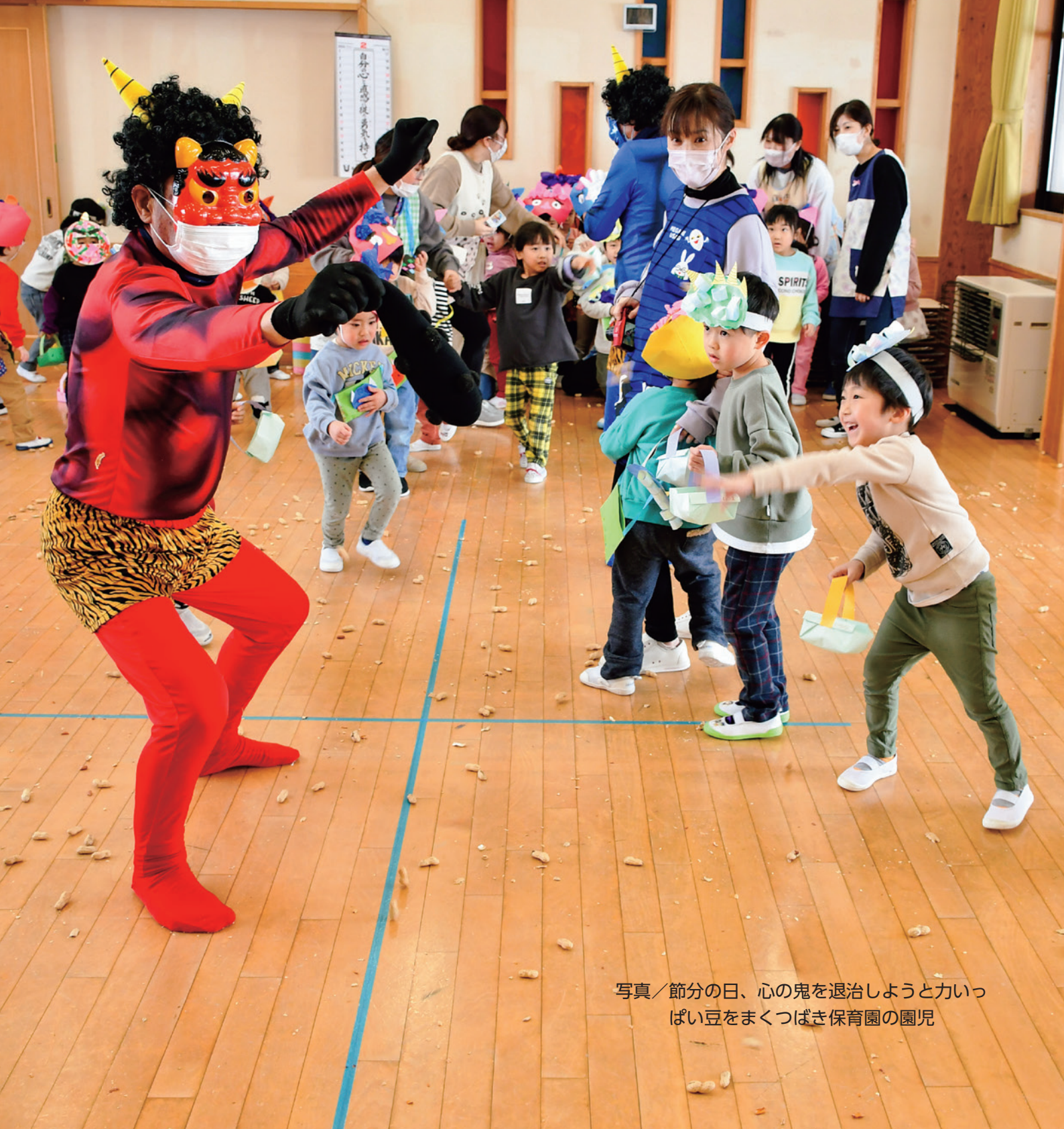
写真／節分の日、心の鬼を退治しようと力いっぱい豆をまくつばき保育園の園児