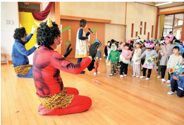
園児の活躍により最後に鬼は降参しました

心の鬼を退治するぞ！ 2月3日の節分に合わせ、町内幼児施設で豆まきが行われました。つばき保育園では「鬼は外、福は内」と「豆まき」を歌っている最中に、鬼がやってきました。園児たちは、突然の鬼の登場に驚き、逃げ回ったり、泣いてしまったり。それでも力いっぱい豆をまき、最後には鬼が降参し、帰っていきました。 園児に自分のどんな心の鬼を退治したのか尋ねると、「弱虫鬼！」「だから鬼を退治した」と晴れ晴れとした表情で答えてくれました。