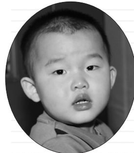
きょう かんねんくん