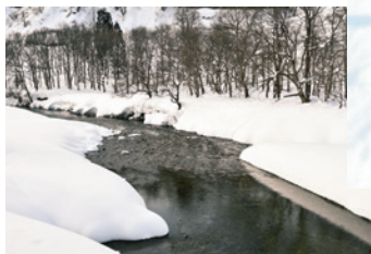
透き通っている白川

途中、白川を眺めると、川底の砂利が見えるほど水が透明で、静かに流れていました。白川では、春になると多くの魚を見かけることができます。また、真っ白な雪の上には、木の枝の影が影絵のように映り、動物たちの小さな足跡がかわいらしく、まるで絵本のような景色も楽しむことができました。