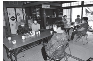
地域コミュニティの形成

地域づくりの停滞が心配される中で、これからの時代に必要な住民自治について、地域と行政、さらには多様な主体と一体となった取り組みを推進していきます。