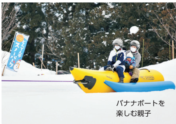
バナナボートを楽しむ親子

会場では、雪上滑り台、ストラックアウト、スノーシュー、スノーモービル、バナナボートが体験で