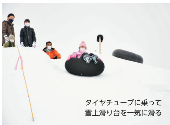
タイヤチューブに乗って雪上滑り台を一気に滑る

2月19日は、青空が一面に広がる中、多くの親子連れが雪遊びを楽しみました。バナナボート体験では、スノーモービルに引かれながら、広大な雪原を周回。乗車した親子からは大きな歓声が聞こえ、楽しさが伝わってきました。初めて家族で訪れた方は「広い敷地で、さまざまな雪遊びを体験できてうれしい」と笑顔で話し、男の子は「バナナボートにもう一回乗りたい」とバナナボートを気に入った様子でした。