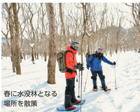
春に水没林となる場所を散策

2月13日は、白川湖周辺を散策。4月には水没林となる一帯も厚い雪に覆われていました。2、3日積雪が無かったため、適度に雪が硬く、歩くとも「ギョツ、ギョツ」と歩く音も楽しめました。