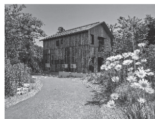
飯豊型エコハウス

環境負荷を減らしつつ、身近なエネルギーから見直しを行い、木質バイオマスなどの利用促進やゼロカーボンの推進を図り、災害に強い飯豊型の循環型社会構築を目指していきます。