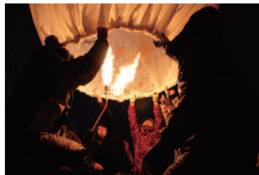
撮影地／中津川地内（雪祭り会場）