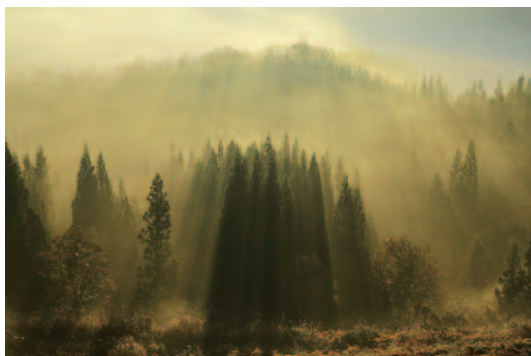
撮影地／中津川地内