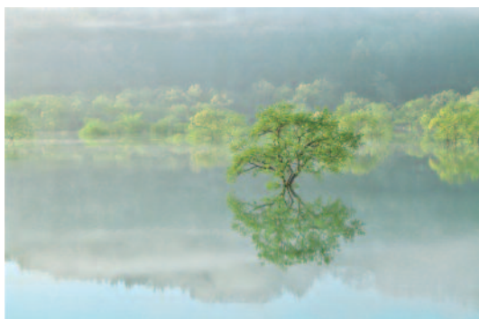
撮影地／中津川地内（白川ダム湖岸公園）