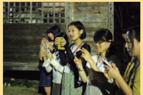
勇壮な獅子舞の練習を見学する様子