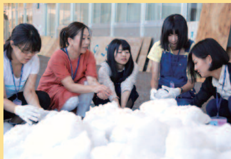
真夏の雪に触れる参加者