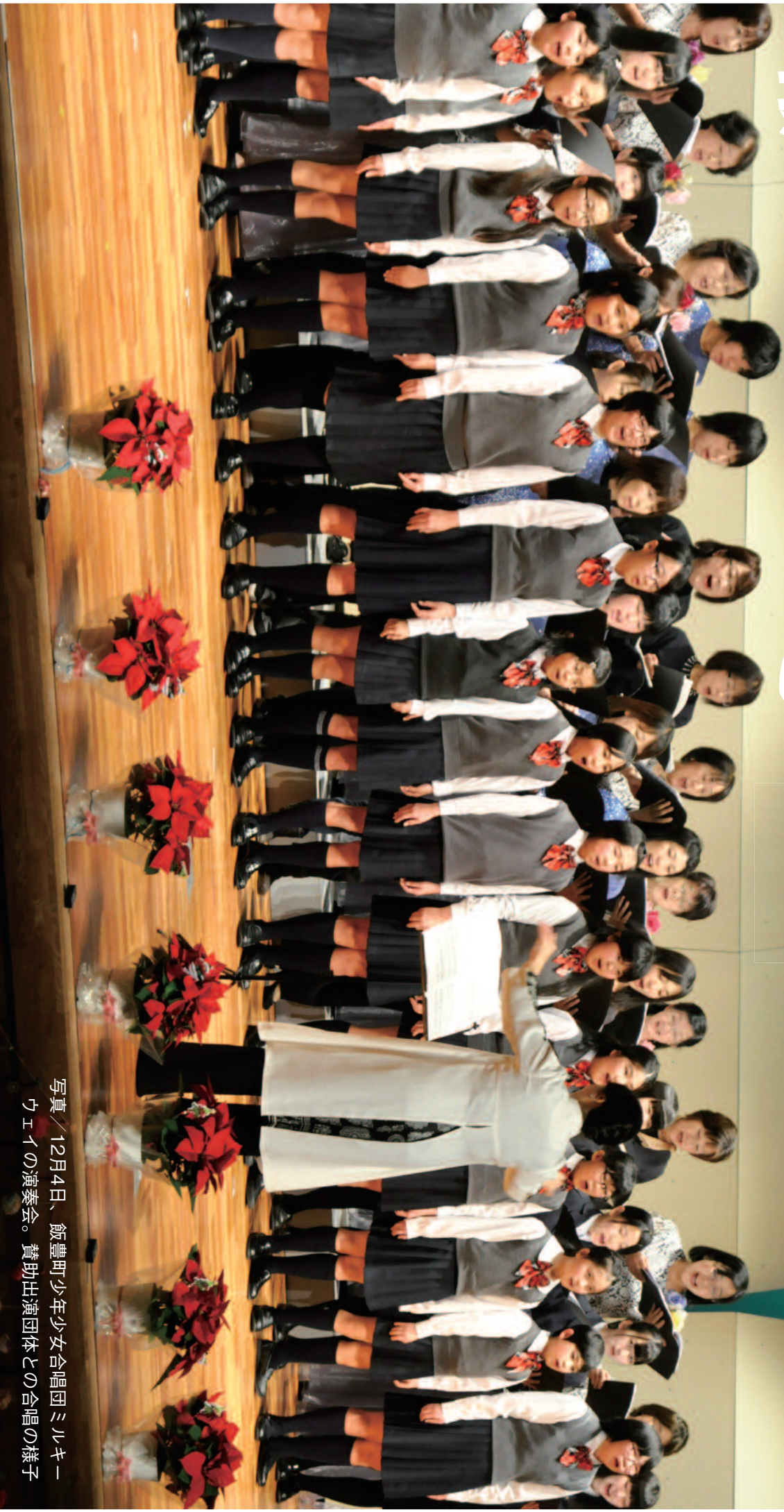
写真／12月4日、飯豊町少年少女合唱団ミルキー ウエイの演奏会。賛助出演団体との合唱の様子