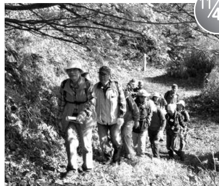
とうほく街道会議 (飯豊町宇津峠、川西町、小国町)