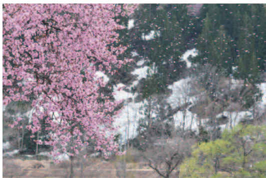
撮影地／中津川地内