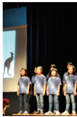
合唱に影絵をつけて音楽の世界を表現

12月4日、あ～すで、ミルキーウェイの演奏会が行われました。同合唱団は平成23年に結成され、現在は年中児から中学生まで23名が所属しています。この日は、合唱のほか、楽器演奏や影絵など多彩な演出で練習の成果を発表しました。また、コラル・ド・めざみとプロージット、長井高校音楽部が、賛助出演しました。フィナーレに出演者と来場者で「いつも心に」を合唱しました。