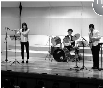
めざみの里音楽祭 (あ～す)